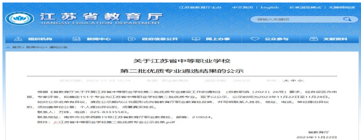
图 1-2-1 省第二批优质专业遴选结果的公示文件

2023 年学校继续与江苏旅游职业学院、江苏商贸职业学院、南通职业大学、南通科技学院、江苏工程职业学院五所高校联合实施中餐烹饪与营养膳食专业、中西面点专业、高速铁路专业、幼儿保育专业、艺术设计专业中高职贯通培养 3+3 项目，新增南京旅游学院的航空服务专业。幼儿保育专业获评 2023 年南通市职业教育贯通培养示范专业。旅游服务与管理专业获评江苏省中等职业教育优质专业。