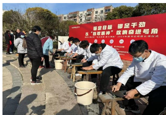
图 2-4-3-1 锦泉磨刀队服务场面 图 2-4-3-2 志愿者服务合影