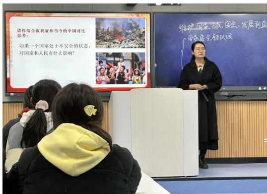
图 2-1-1-1 校内德育课堂

该校牢牢把握立德树人这一根本任务，对思政育人进行顶层设计，推进各类课程与思政课程同向同行，构建学校思政、专业思政、课程思政三个层次，形成全员参与、全面覆盖、全程育人的“大思政”育人格局。学校充分挖掘各类课程思政元素，发挥每门课程、每个课堂、每个活动的育人职责，同向同力，形成以学科教师为主导，以思政教师为重点，以班主任队伍为支撑的全员思政工作格局。