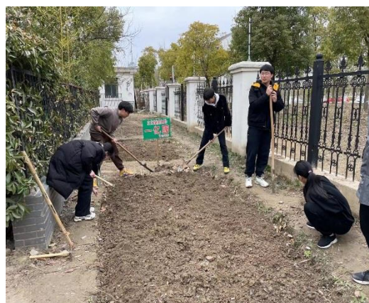
图 2-1-4-1 22 旅航的“一亿园” 图 2-1-4-2 学生在“田间”劳动