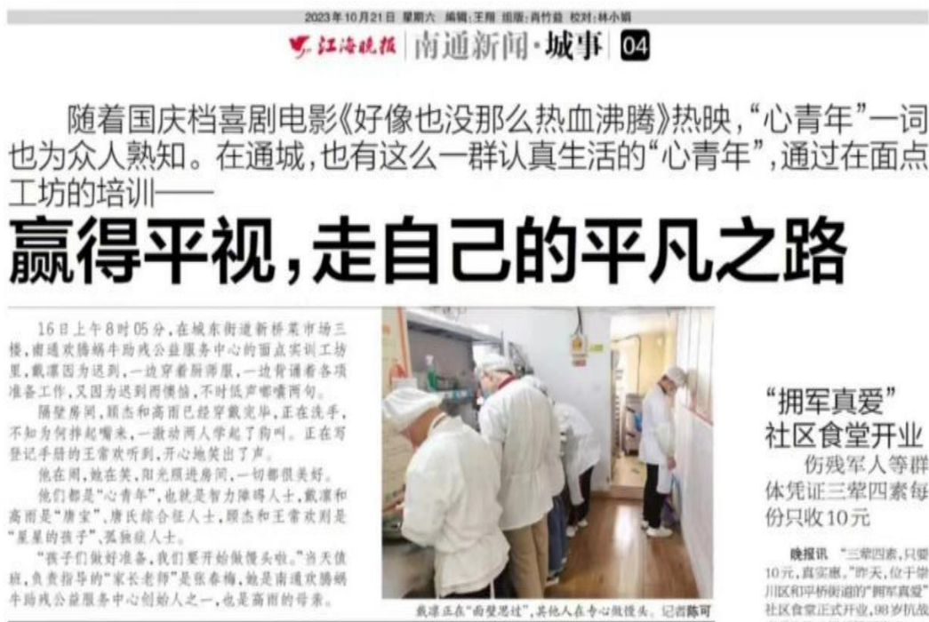
图 3-3-2-1 《江海晚报》报道学校对特教中心学生开展专业教学

南通欢腾蜗牛助残公益服务中心也经常有南通市旅游中等学校老师的身影。导游老师通过带“唐宝”们讲解狼山景点，让孩子们接触社会，领略大自然的美。面点老师通过教学让孩子们掌握谋生的技能。面点实训工坊的运营，让孩子们赢得了社会的尊重。