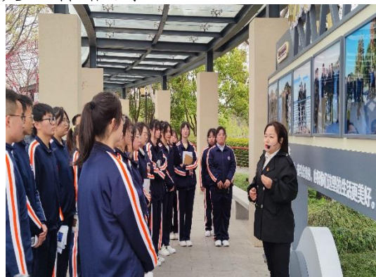
图 2-1-1-2 校外德育课堂